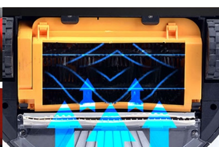
Rodillo con doble cepillo.