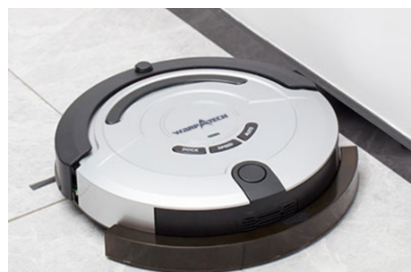
Función de limpieza en seco y húmedo.