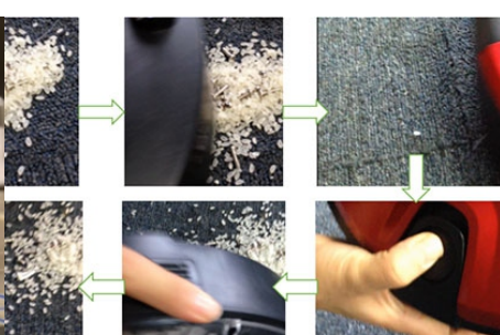
La aspiración fuerte puede absorber fácilmente el polvo y otros tipos de basura.