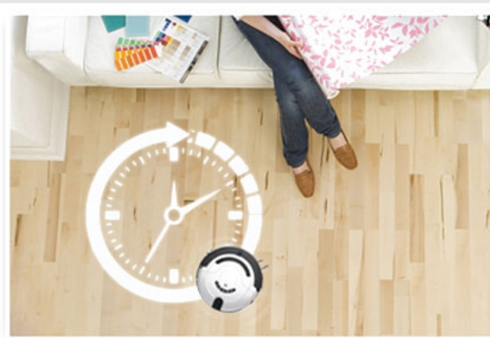
Planificación de limpieza