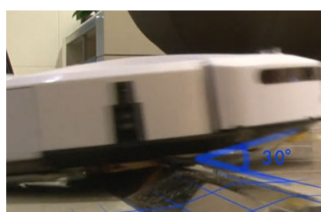
La capacidad de escalada puede cruzar la mayoría de los obstáculos.