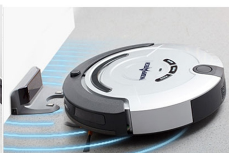
Siempre listo. Se recarga automáticamente en su estación de carga.