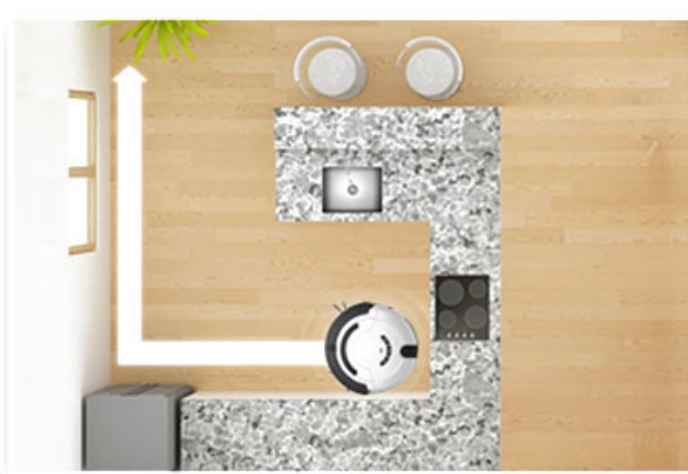
Limpieza al borde