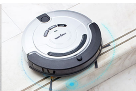
Sensores infrarrojos para acantilados, se mueve de manera segura en su hogar, usando sensores anticaída para limpiar alrededor de la escalera.